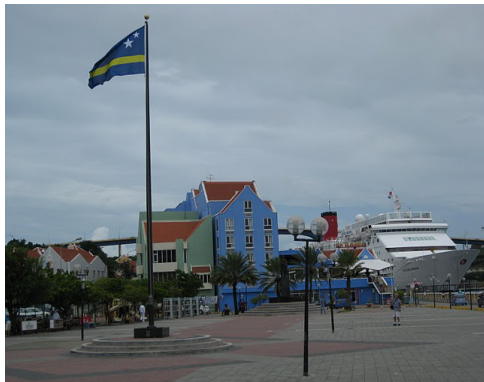
Tico, 40 jaar, Curaçao